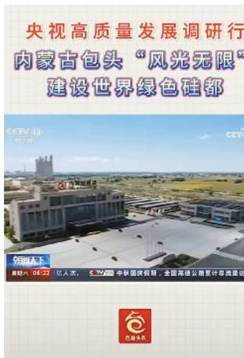
央视新闻频道播出内蒙古通威画面

自 2017 年落地包头以来,通威永祥备受各级党委政府的关心支持,“包你满意”“包你放心”的营商环境坚定了通威在包头投资发展的信心。2023 年通威在高纯晶硅领域已形成 42 万吨产能规模,市场占有率全球第一。与此同时,内蒙古通威高纯晶硅落户包头后,坚持绿色高质量发展,建成“塞上江南”,充分发挥头雁作用,带动光伏下游企业落户包头,积极推动地区经济高质量发展。当前,光伏产业蓬勃发展,通威将继续深耕包头,大力推进高端制造、智能制造、绿色制造,依托包头良好的营商环境、丰富的“清洁能源”资源优势,做专、做精、做强,为打造“世界绿色硅都”注入新动能,为我国“双碳目标”的实现贡献通威力量!