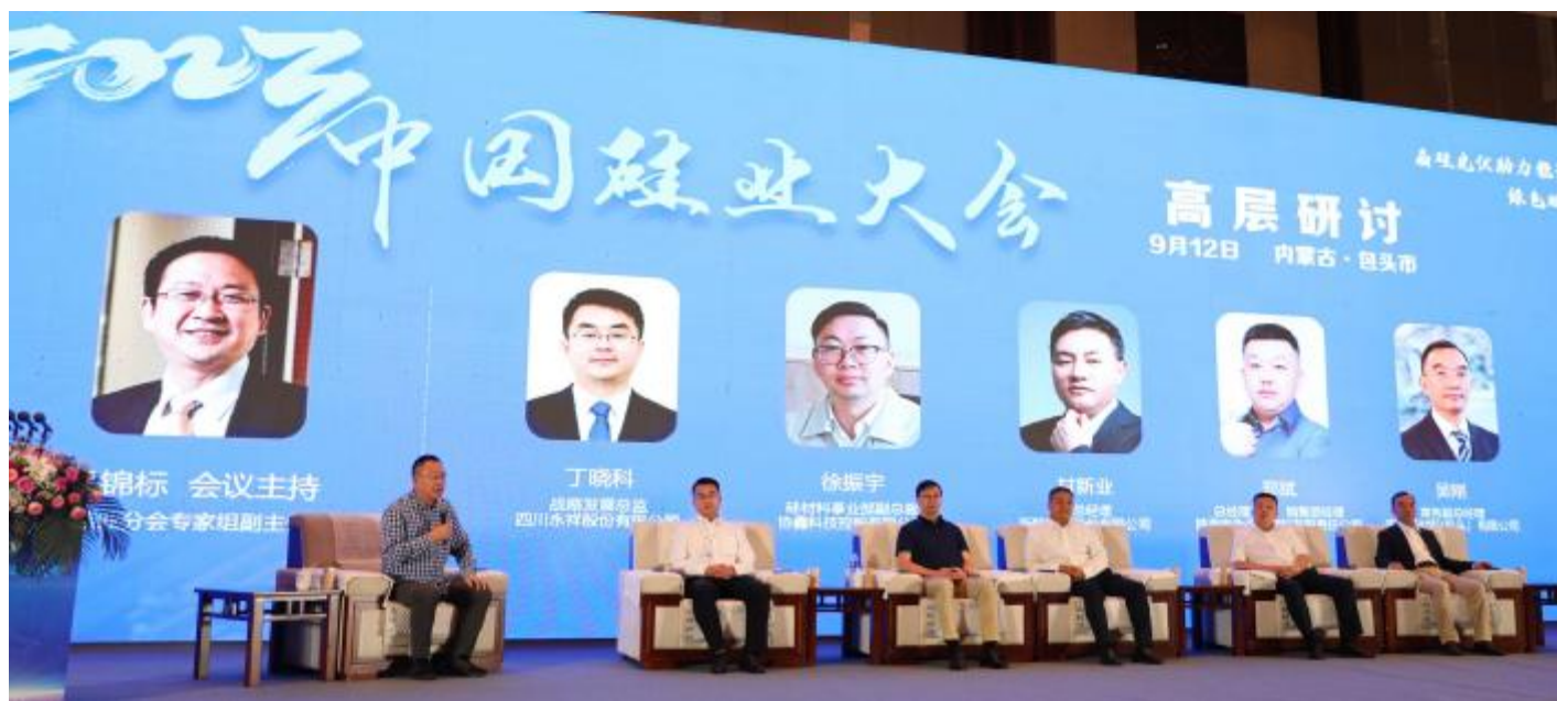
永祥股份受邀参加 2023 年中国硅业大会