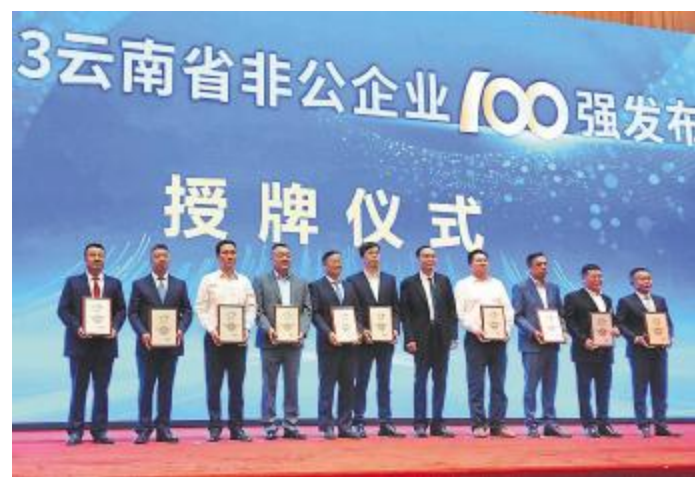
云南通威荣登“云南省非公企业 100 强”“云南省非公企业制造业 20 强”榜单

力。得益于公司长期对技术创新工作的投入和重视,此次四川省技术创新示范企业复核顺利通过,是对永祥技术创新工作的再次认可与肯定。永祥股份将积极发挥龙头企业的带动和示范作用,为“中国绿色硅谷”建设贡献永祥力量。