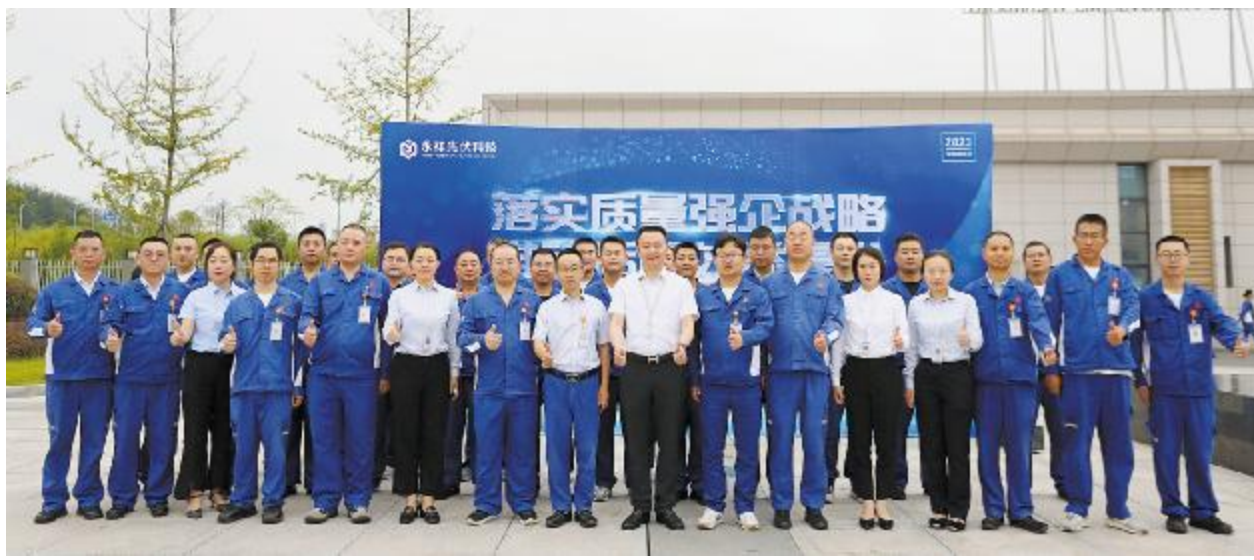
永祥光伏科技、硅材料成功开展2023年“质量活动月”启动仪式

质量是立业之本、强国之基，事关民生福祉。2023年9月是第46个全国“质量月”，自1978年起，每年9月被定为我国的“质量月”。在国家有关部门的倡导和部署下，全社会，尤其是大型企业广泛参与“质量月”活动，全民质量意识与质量水平稳步提升。全国“质量月”期间，为全面贯彻落实《质量强国建设纲要》部署要求，积极落地永祥股份“落实质量强企战略，推动质量效益提升”主题活动的高效开展，9月以来，各分、子公司先后举行各类“质量月”主题活动，进一步提高全体干部员工质量管理意识，压实各级质量管理责任，筑牢安全底线，营造良好质量氛围，提升质量管理水平。