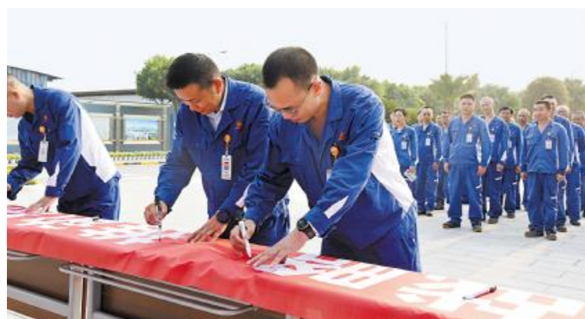
永祥树脂举行2023年“质量月”活动启动仪式现场签字