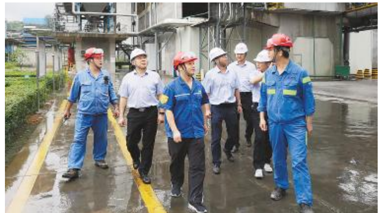
永祥新材料组织管理干部赴东方希望对标学习