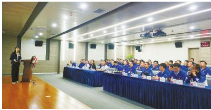
内蒙古通威高纯晶硅管理干部学习会现场