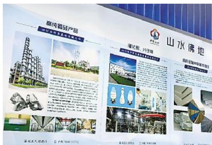
永祥股份亮相国际科技博览会

成果展示。作为半导体工业、电子信息领域和清洁能源环保领域主要原材料的生产企业,永祥多晶硅在展会精彩亮相,获高度关注。参会客商代表纷纷驻足观看、拍照、咨询交流。在清洁能源领域,永祥时刻以技术创新作为企业发展的驱动力,在不断提升晶硅纯度和质量的同时,有效降低了生产成本,为清洁能源的平价推广作出了贡献;在半导体工业、电子信息领域,永祥将持续不断地深耕工艺技术,累积半导体电子级晶硅的研发经验,助推行业不断向前进步。