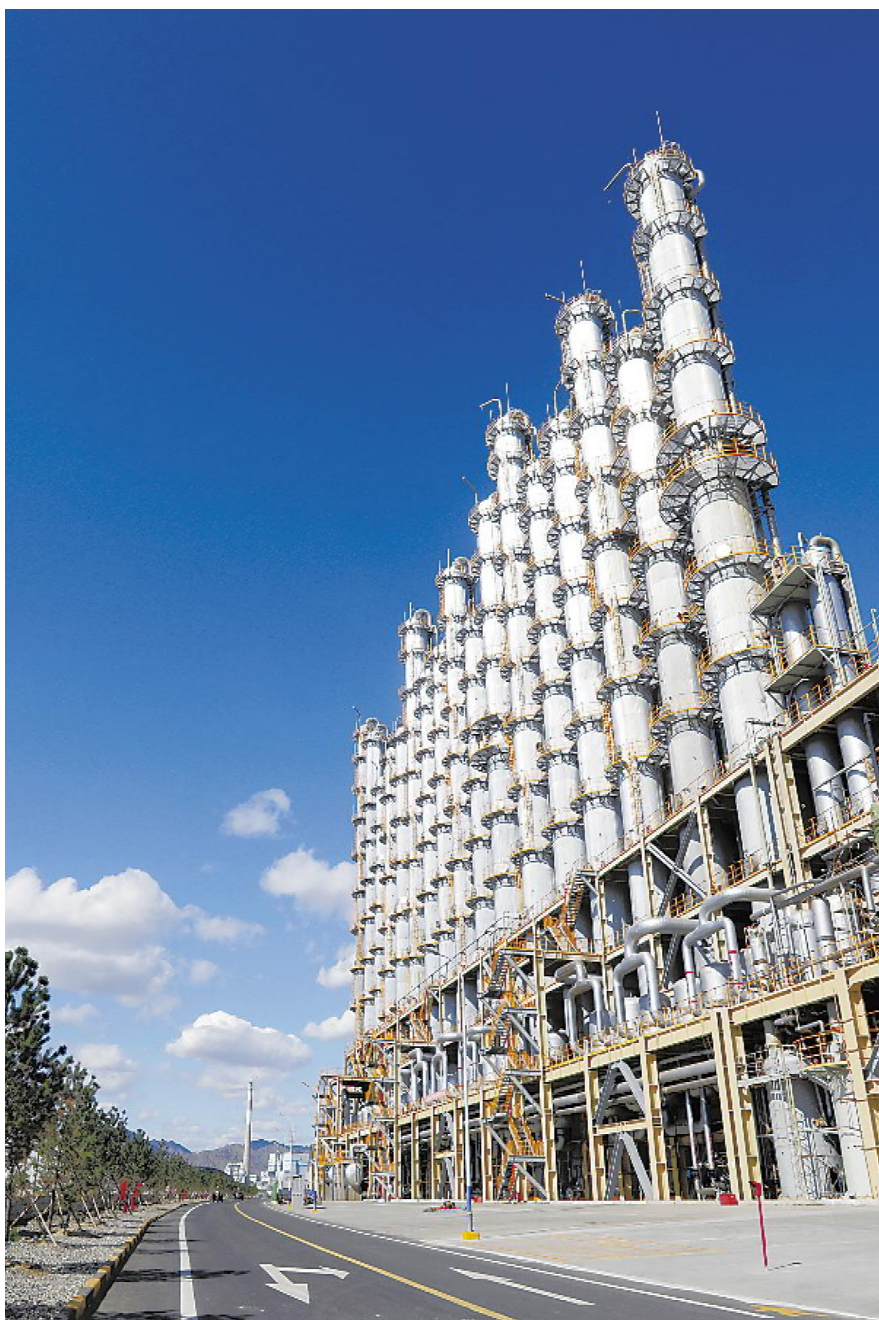
内蒙古通威高纯晶硅精馏塔装置