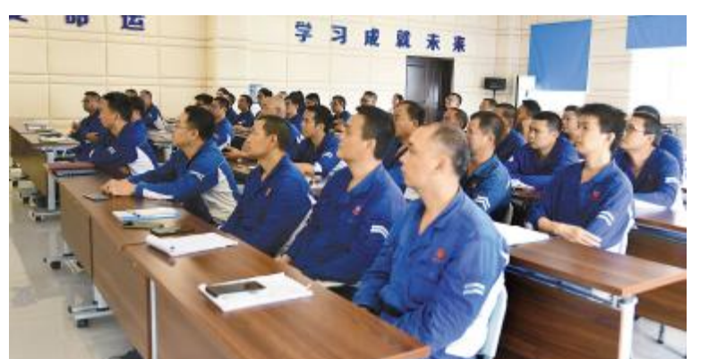
永祥树脂“设备润滑保养”培训现场