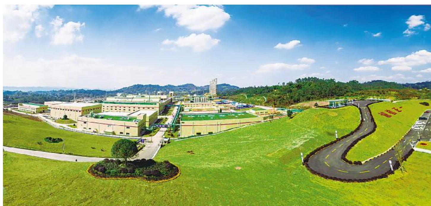
永祥新能源绿色厂区