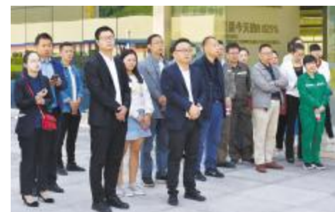
全国质量日活动走进永祥股份

随后,代表团先后前往了公司展厅、中心控制室和观景平台进行了参观,详细了解了永祥的发展历程,高纯晶硅产业的发展状况和市场前景以及公司品管部的规模、质量管理体系的配备、实验室的规划、先进的检验仪器设备、重点工艺指标的质量监控等。通过实地参观和听取介绍,代表团高度肯定了永祥的发展成绩,并表示,永祥领先的技术、花园式的厂区环境都颠覆了大家对传统化工企业的印象。永祥无论是厂区环境、规模、产品质量都走在了行业的前列,无愧四川优秀企业的代表。希望永祥能继续再接再厉,为质量强国作出更大的贡献。