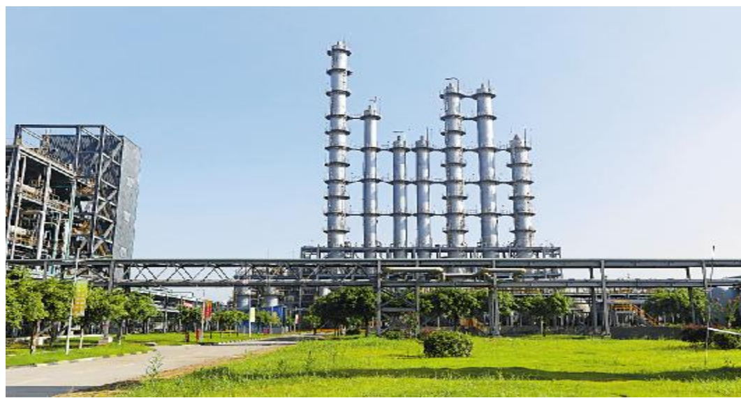
永祥多晶硅绿色厂区