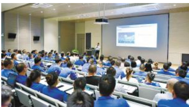
永祥股份各公司开展《永祥经营哲学》宣贯