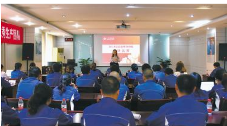
永祥多晶硅、永祥硅材料“精益管理”主题演讲比赛现场

为有效开展作业场所职业健康监管,加强员工健康保护,减少职业危害事故,切实维护员工生命和健康权益。本月初,永祥多晶硅、硅材料积极组织涉及粉尘、噪声、高温、氯气、氯化氢、氯硅烷、电工、机动车、压力容器、视屏作业等岗位生产作业的432名员工进行了职业健康体检。通过开展职业健康体检,有助于公司全面了解员工健康状况,为职业健康管理提供了可靠、真实的依据,使职业病防治工作中提出的“预防为主、防治结合”原则落到实处,同时切实保障了广大员工的身心健康。