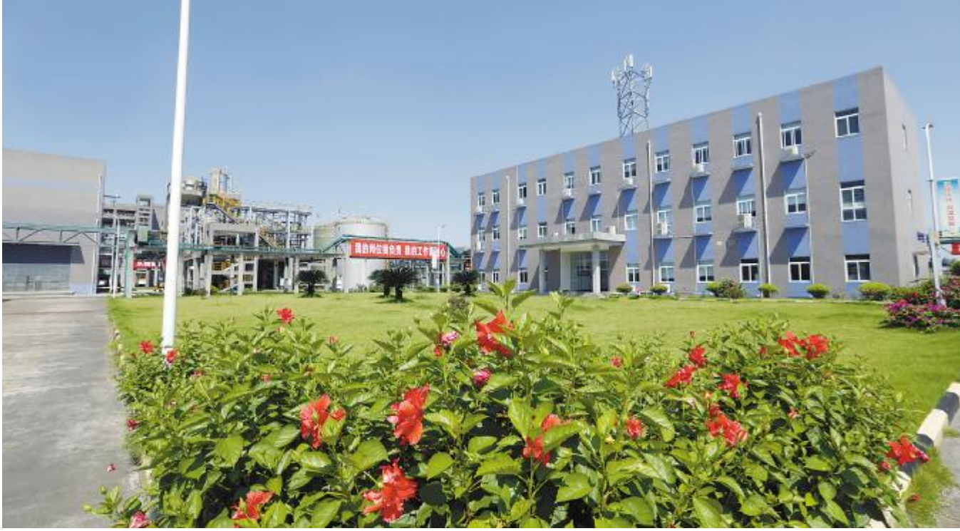
永祥树脂厂区鲜花盛开

9月,永祥股份继续保持安全、稳定、快速的发展态势,永祥多晶硅、永祥树脂、永祥新材料、永祥硅材料、永祥新能源、内蒙古通威高纯晶硅各项生产、经营活动有序开展,各类管理提升、技能培训持续推进,稳中有进,为完成全年目标积蓄能量。