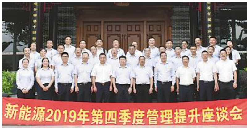
永祥新能源第四季度管理提升座谈会合影