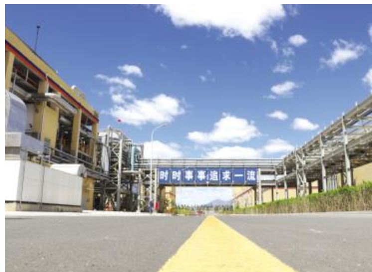
整洁的内蒙古通威高纯晶硅厂区