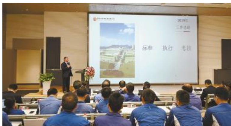
永祥新能源一季度工作总结暨二季度工作计划会成功召开