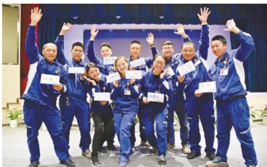
首期提升班上,参训班长展示团队风采