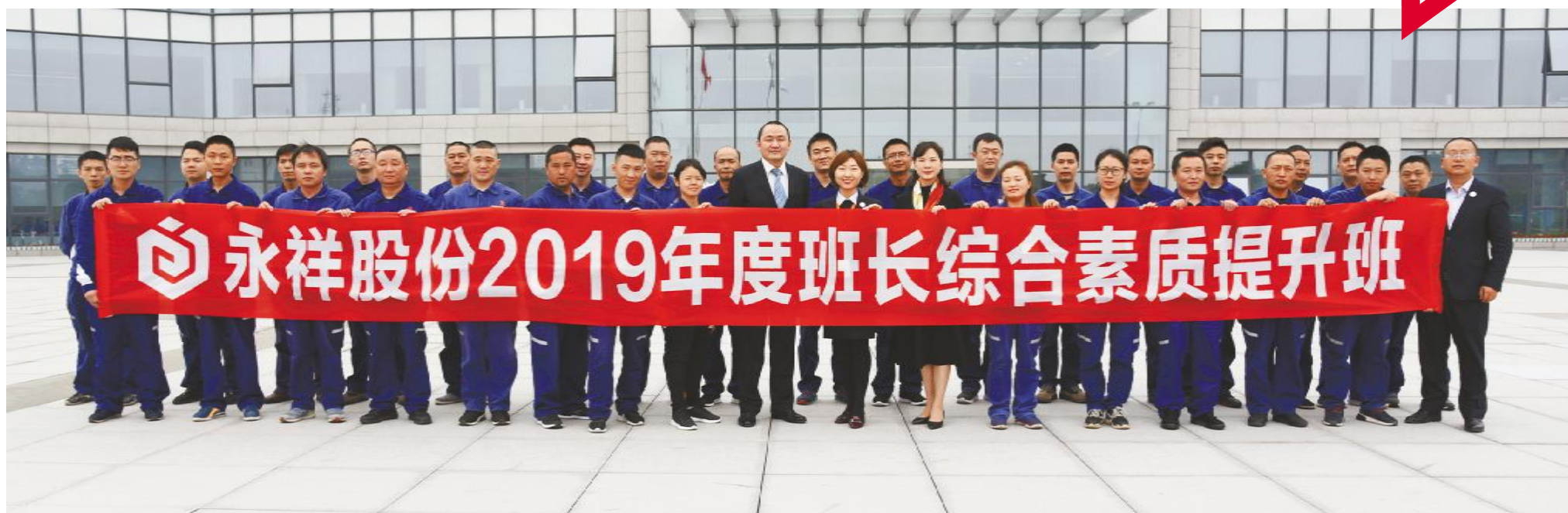
首期班长综合素质提升班开班合影

2019年,永祥股份发布了新的“十六字”经营管理方针——“科技创新,文化引领;双轮驱动,高效经营”,明确了公司2019年前进的方向和目标。其中文化引领即激活企业文化内驱力,通过喜闻乐见的文化活动,文化进入班组,让员工领会文化精髓,持续提升员工满意度,增强员工爱岗敬业、主人翁意识、集体荣誉感,持续打造“军队、学校、家庭”文化。 为切实践行“文化引领”管理思路,推进企业文化建设,永祥股份启动了“2019年度班长综合素质提升班”计划。班组是企业组织生产经营活动的基本单位,是企业最基层的生产管理组织。而班组长是班组生产管理的直接指挥和组织者,也是公司中最基层的负责人,生产经营战线冲锋陷阵的生力军。提升班组长的综合素质将有利于永祥班组建设的开展,进一步夯实公司发展基础。