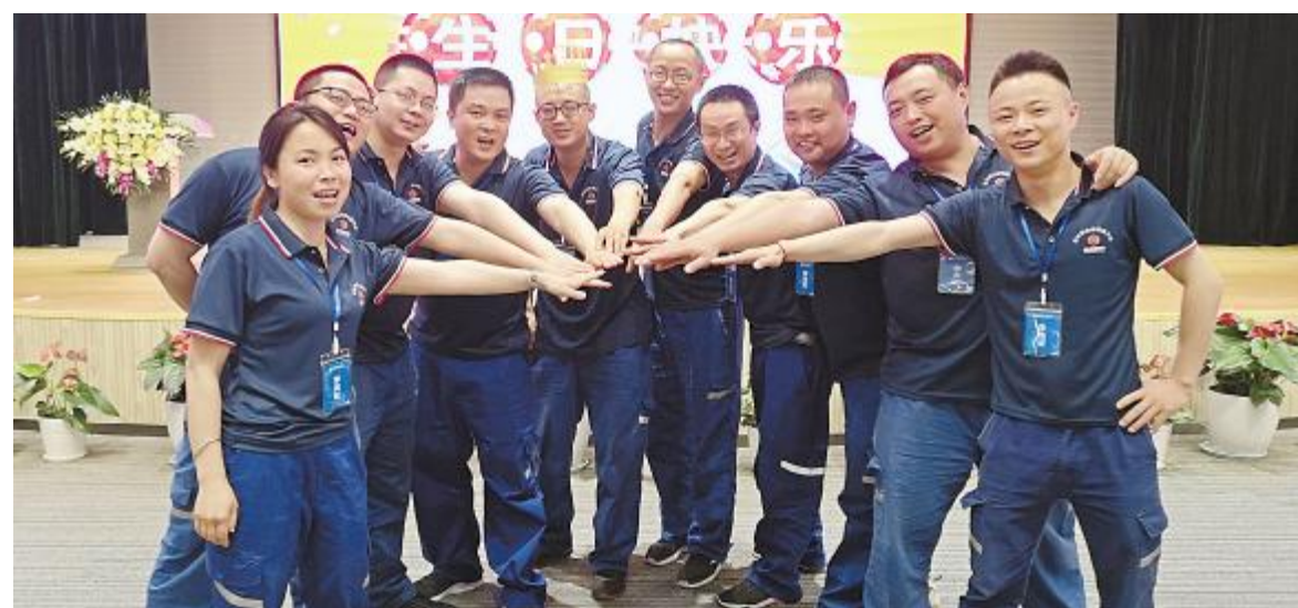
第三期提升班上,公司为参训班长过生日

“希望大家在培训班的学习生活中,像兄弟、像战友、像家人、像同学一样结下深厚的友谊,并将所学东西带回家里,带到工作中去,从而感染整个团队。”