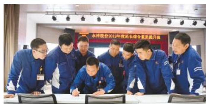
首期提升班上,参训班长开展分组讨论

在这三天的封闭式学习中,我收获良多。首先要感谢领导对我们第一期班长综合素质提升班的关心和重视,让我体验了一段难忘的培训经历。通过此次培训,我充分了解了班组在工作中的“管理意识、指导技能、员工培训、工作改善”等知识内容,在素质上有了进一步提升,让我对班组管理有了全新的认识。我将以本次培训为起点,提高自身综合素质,强化科学管理意识,提升班组管理水平,带领班组成员,设定一个共同明确的目标,朝着这个目标制定行动方向,有计划、有步骤的实施,为公司发展贡献全部力量。