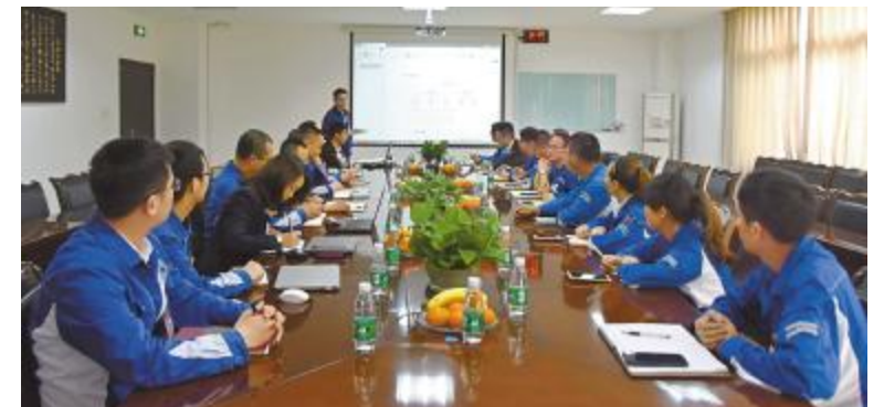
永祥硅材料首次“空巴”活动成功举行