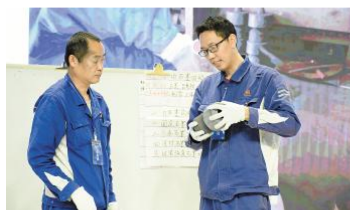
第二期提升班结业仪式上,参训班长进行团队展示