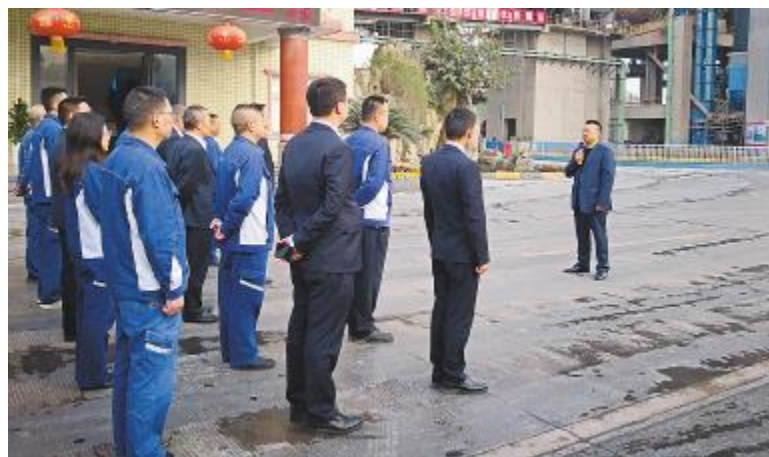
永祥新材料召开二季度工作动员大会