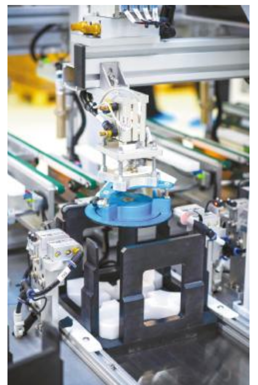
自动化设备助力企业发展

是永祥硅材料在“小而精”发展道路中迈进的一大步,面对成绩,永祥硅材料干部员工在采访中纷纷表示,未来将继续践行“定目标、明分工、抓落实”9字管理方针,充分运用各项管理提升工具,发扬履职尽责的工匠精神,努力实现“自我消化、自我总结、自我提升”能力的突破性发展,为公司发展不断造新血、添动能,带着激情与成就感奋勇前行!