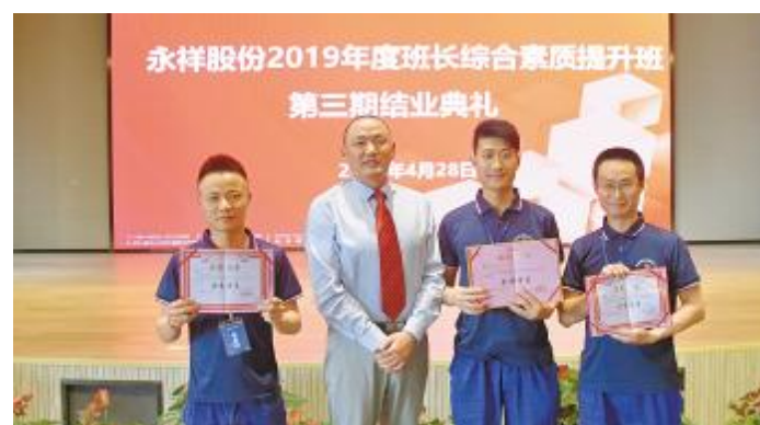
第三期提升班结业仪式上,培训老师为优秀学员颁发证书