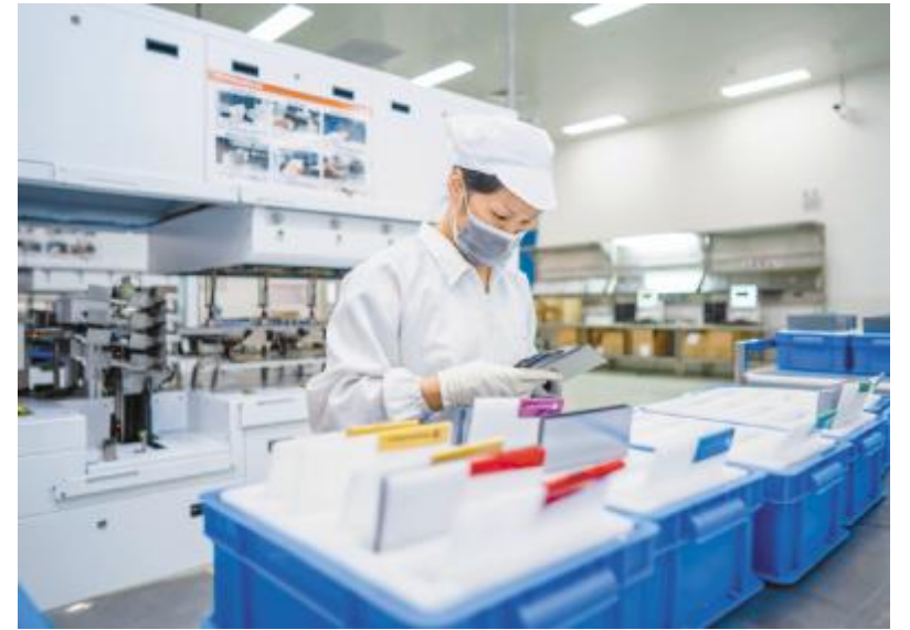
严格把控产品质量