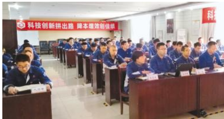
永祥多晶硅科技创新推进会现场