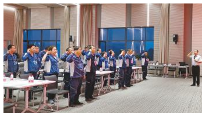
第二期提升班上,参训班长在培训前进行安全宣誓