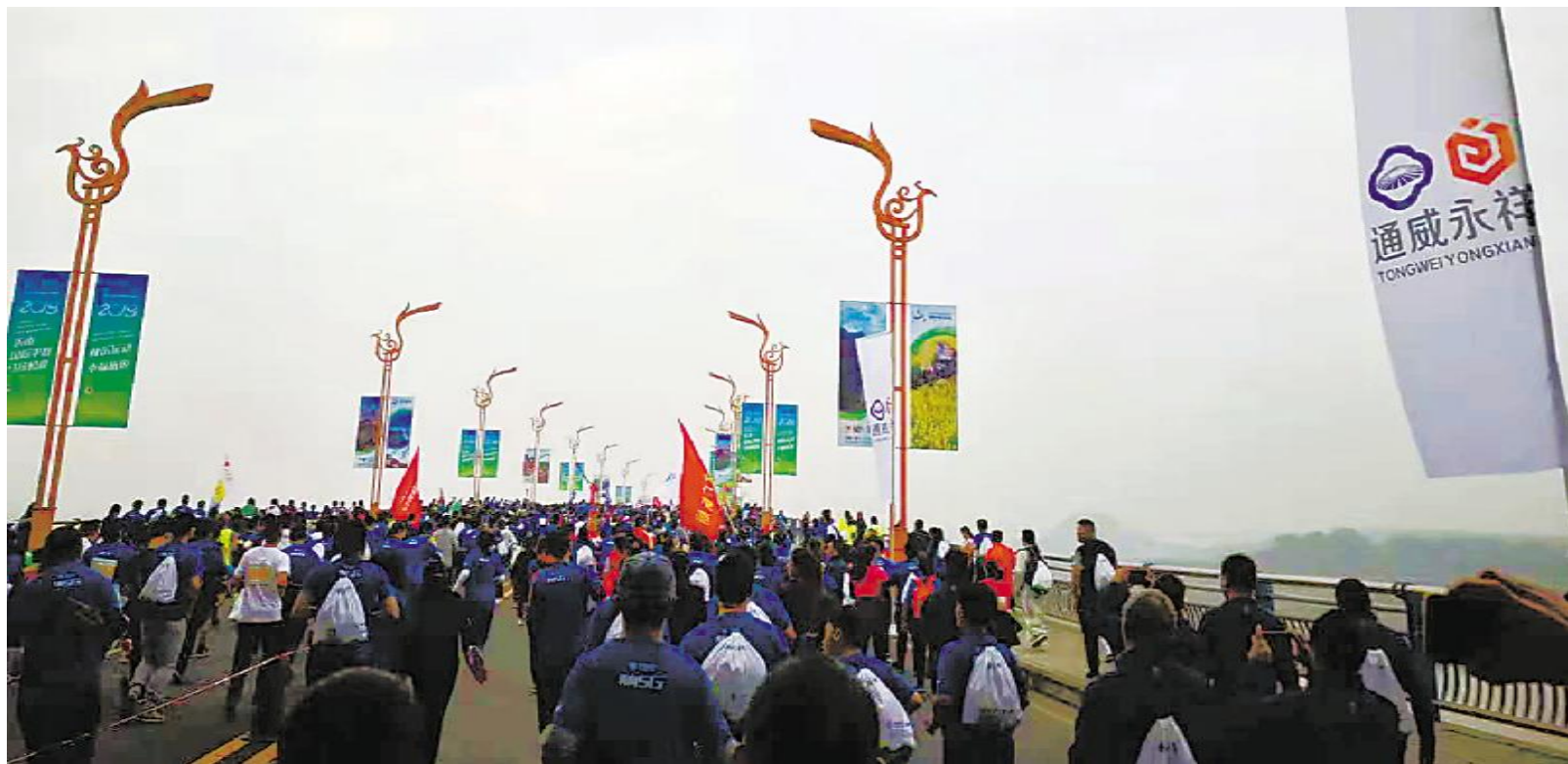
比赛现场,通威和永祥元素随处可见