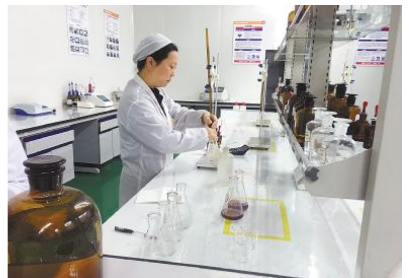
永祥新能源做好开车前样品分析准备