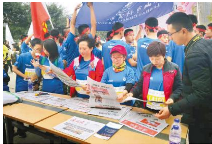
永祥文化刊物吸引参赛选手关注

本报讯(记者 唐黄之 通讯员 左伟)11月11日上午,2018乐山国际半程马拉松赛鸣枪开跑。本次马拉松赛报名选手来自世界各地,共有来自肯尼亚、埃塞俄比亚、韩国、日本、印度、新加坡、泰国、越南、老挝等23个国家和地区的外籍选手150人、省外选手1158人、省内选手9848人参加,堪称影响力巨大,受欢迎程度可见一斑。