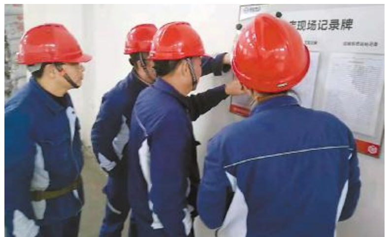
永祥树脂开展环保专项检查

整个考核研讨会在对题目严格把关的过程中,不仅自始至终把握员工的切身利益的核心点,更实实在在的从技能层面筛选出合格员工中的优秀者,保证整个技工评定工作高效顺利的开展。