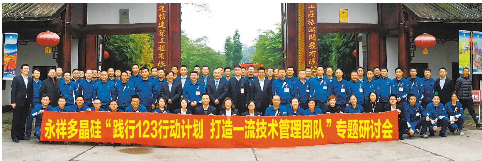
永祥多晶硅“践行123行动计划”专题研讨会合影