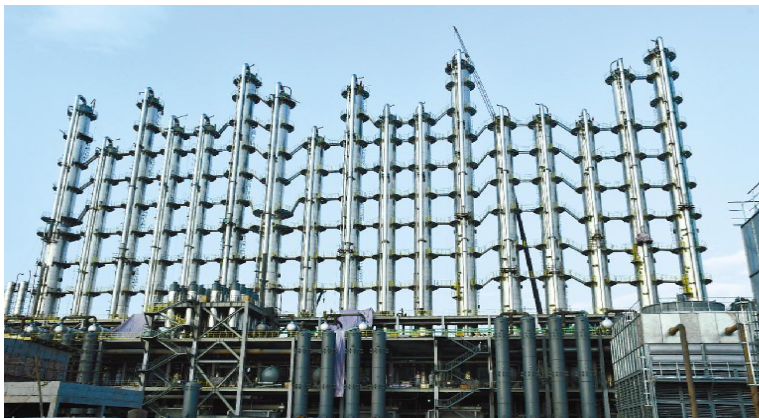
永祥股份新能源项目精馏塔

永祥新能源高纯晶硅项目于2018年1月1日打下第一根桩,历时12个月建成。随着项目的投产,永祥股份四川、内蒙古两地高纯晶硅生产基地将形成8万吨/年产能。在产品品质上,永祥新能源项目充分应用永祥十多年的技术积累和科研成果,在工艺设计先进性、系统运行可靠性等方面进行了数十项优化和提升,项目达产后超过70%的产品能满足P型单晶和N型单晶的需要,进一步替代进口,缓解国内高纯晶硅依靠进口的局面。项目的顺利投产,离不开四川省、乐山市、五通桥区各级领导的关心。离不开通威总部、各兄弟公司的支持。更离不开全体永祥人的全力以赴,他们在岗位上充分发挥工匠精神,团结拼搏,用只争朝夕的精神全力打造精品工程。