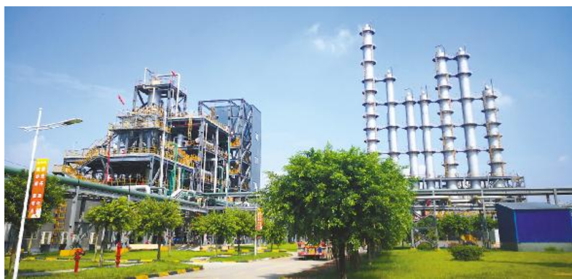
永祥股份绿色厂区

本报讯(记者 龙小龙 唐黄之)11月20日,四川省民营经济健康发展大会隆重召开,四川省委彭清华书记出席大会并讲话,省委副书记、省长尹力主持,省政协主席柯尊平、省委副书记邓小刚出席。1500位民营企业代表、500多名党政领导干部和各方面代表人士汇聚成都主会场、3万多人在各地分会场参会,共商民营经济发展大计。会上,永祥股份旗下永祥多晶硅荣获“四川省优秀民营企业”荣誉称号,通威股份董事长兼总经理段雍出席并领奖。