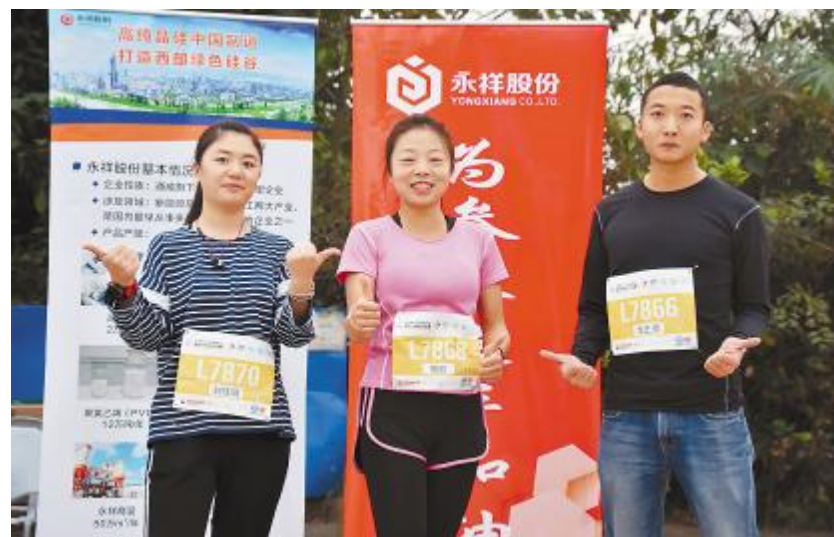
永祥股份员工参加比赛,展示公司精神风貌

台,驻足了解永祥股份,兴致勃勃地阅读企业文化刊物;永祥工作人员热情地为选手们送上矿泉水和提供休息座椅,介绍公司概况,宣传企业文化,讲述永祥的发展理念。相关负责人告诉记者,通过此次国际半程马拉松赛,永祥股份向外界宣传和展现了公司绿色高质量发展、乐于担当社会责任的优秀企业形象,在乐山老百姓心中塑造了良好的口碑。