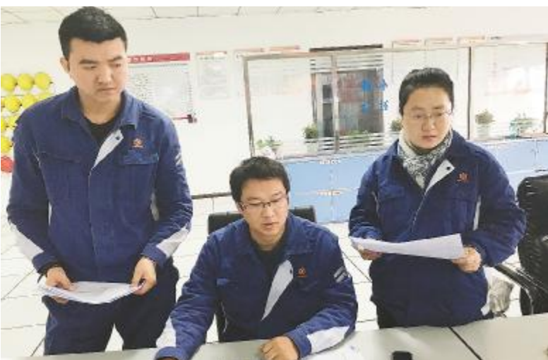
永祥新材料开展技工等级实操考试