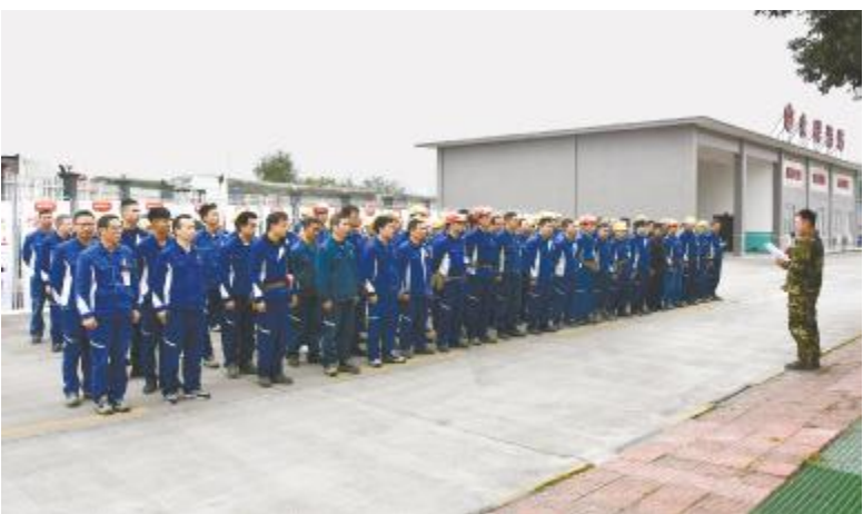
永祥硅材料联合永祥多晶硅举行员工消防技能大比武活动