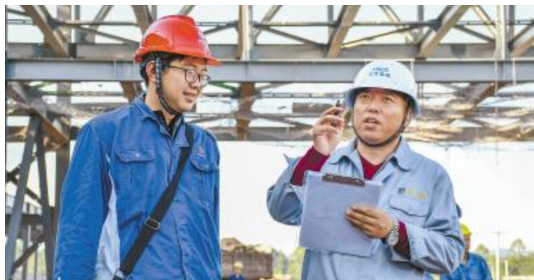
永祥新能源员工与施工方通力协作,共同确保项目建设又好、又快完成

在这块充满希望的土地上无论是烈日酷暑、大雨磅礴,还是雪虐风饕、寒风刺骨,也就多了一个忙碌的身影,奔波劳累,废寝忘食。在工程建设上,他统筹全局、运筹帷幄,从土建到设备安装,从管道铺设到人员调配,工段大大小小的事情,他无一不亲力亲为,总会把事情做的有条不紊,每一件事情都会制定一个时间节点完成,层层推进最终保证质量完成施工。他敢为表率,每天都会到现场检查施工质量以及管道铺设进度,发现问题立即会通知施工单位负责人到达现场一同商榷整改,为了弄懂两件同样是运用到还原炉中的零部件,分别向两个厂家请教,反复琢磨最终才敲定用哪一个。