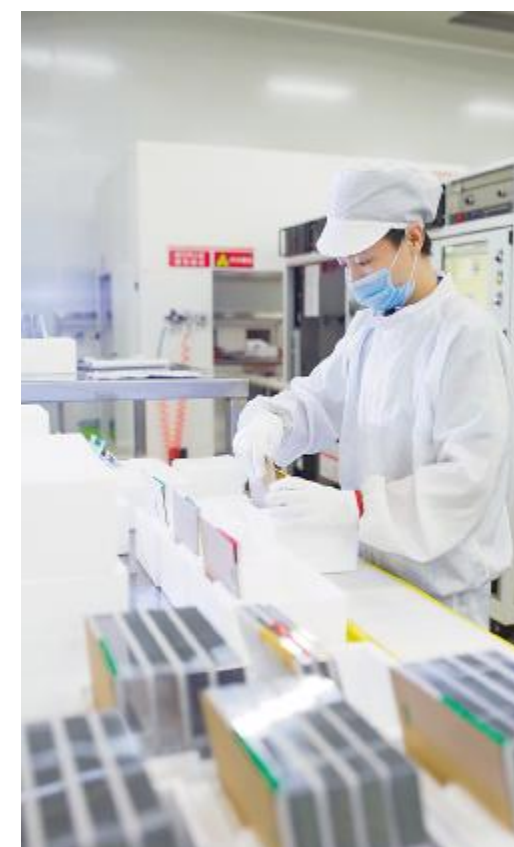
永祥硅材料打造无尘车间

这样的例子在永祥还有很多,通过理念引领、属地管理、技术创新,永祥取得了环保、效益的双丰收,成为了企业绿色发展的典范。