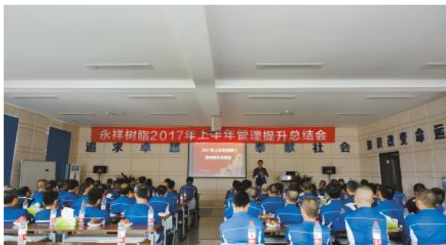
永祥树脂管理提升总结会现场

与会人员分小组讨论了各主工序PID,从安全、系统稳定性、员工可操作性等方面出发,梳理各项流程,优化现有工艺,力求在新项目上做到精细化、标准化,将先进性、科学性做到极致,切实有效地让晶硅产量质量更上新台阶,进一步落实刘主席和集团要求的技术领先、制造领先、成本领先、管理领先、团队意识领先、团队风清气正领先。