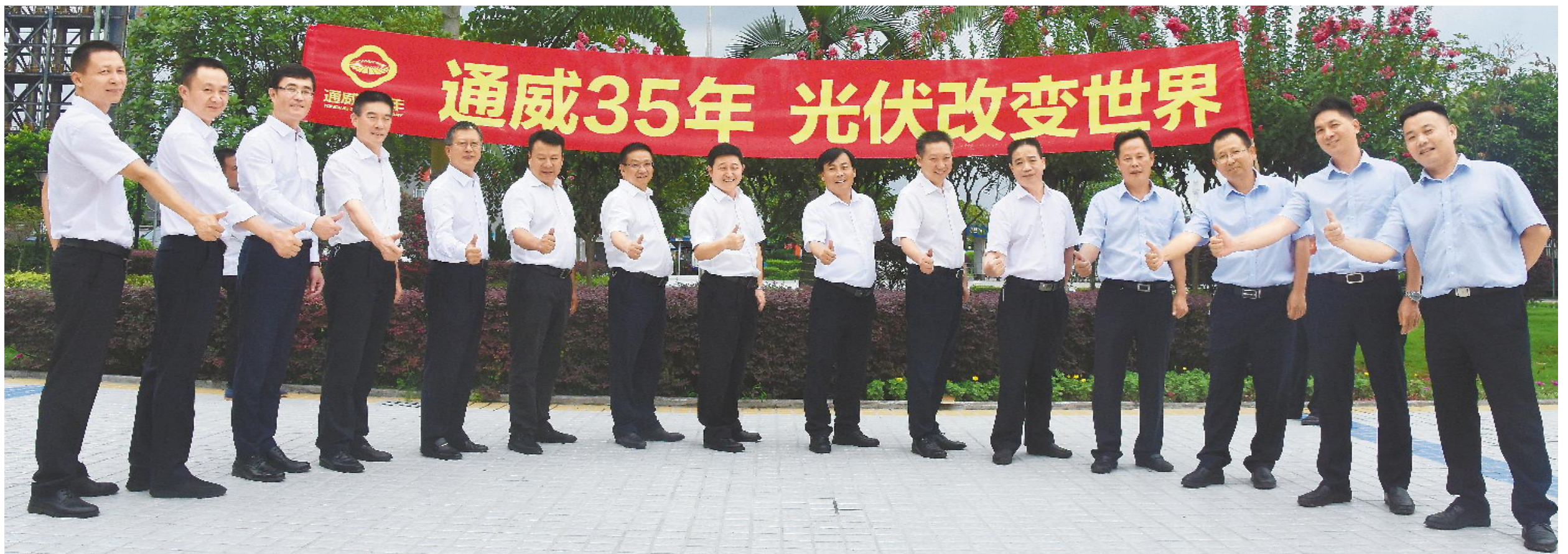
永祥管理团队热烈祝贺通威 35 年华诞