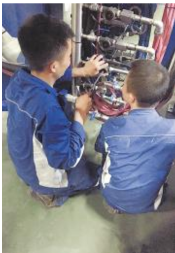
永祥硅材料现场模拟更换叶轮

在安全环保方面,永祥树脂发出“企业要发展,不能以牺牲环保为代价”的要求,各部门车间积极自查并全面落实治理措施。以聚合车间为例,车间整改了干燥系统,解决了母液池溢流这一难题,也为车间推进环保治理提供了信心和经验。