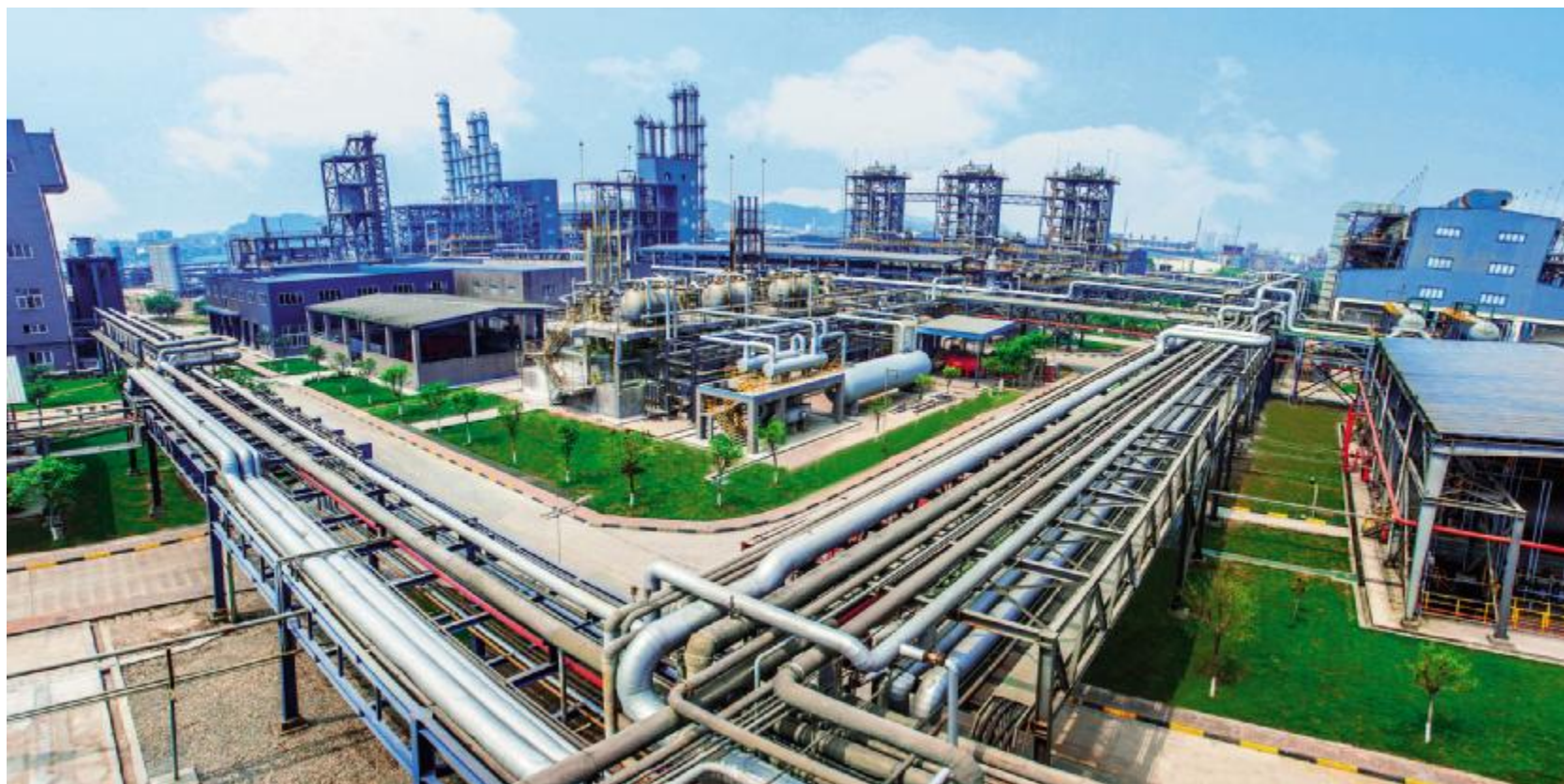
循环经济产业链是永祥股份最大的环保设施